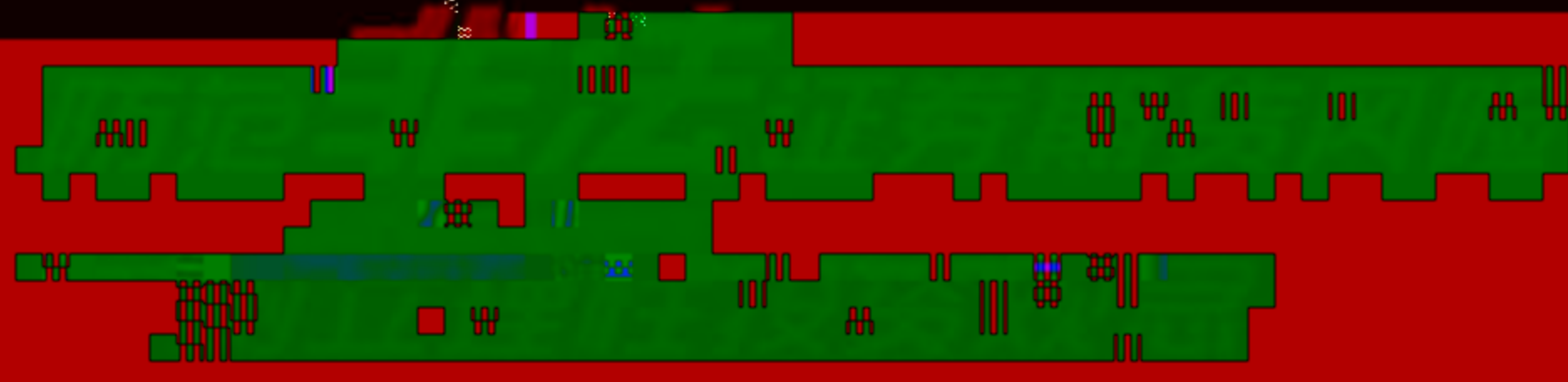
图 1 5.15 全国股转系统投资者教育日